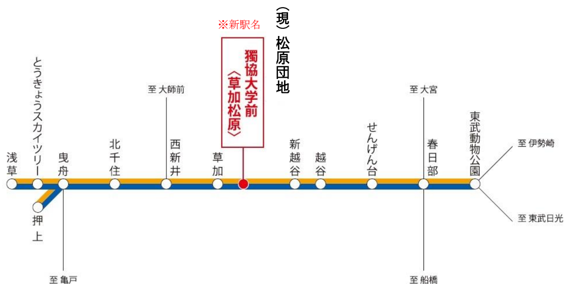
△ 東武スカイツリーライン路線図 (主要駅のみ掲載)