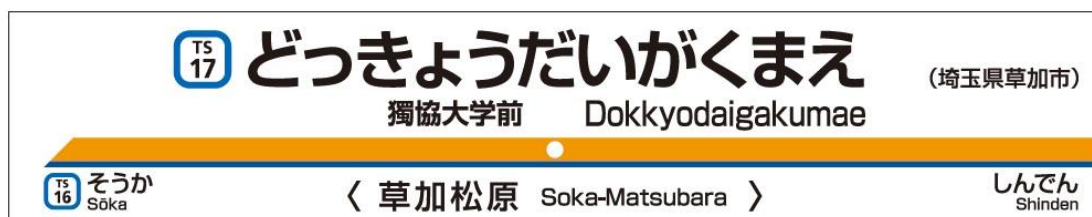
△ 駅名改称後の駅名標板イメージ

※一般のお問い合わせ先表示は、東武鉄道お客さまセンター ☎03-5962-0102